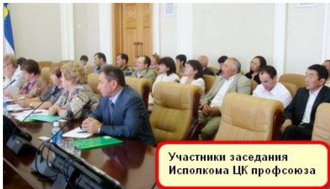
Участники заседания Исполкома ЦК профсоюза

Среднесписочная численность работников по полному кругу предприятий транспорта 12676 чел.