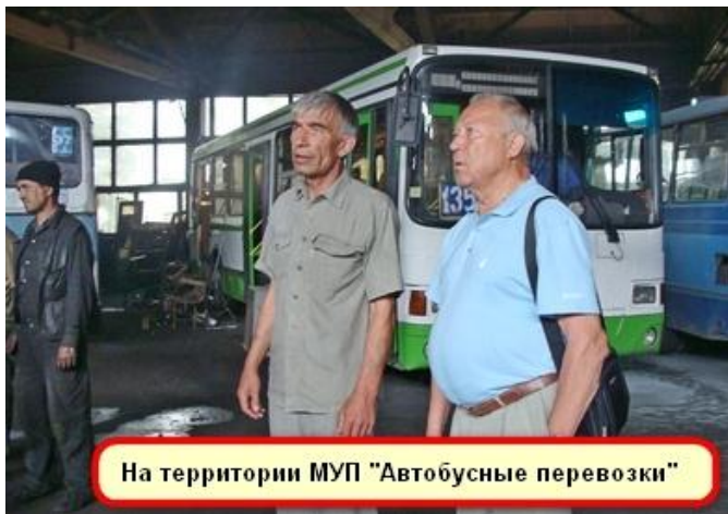
На территории МУП "Автобусные перевозки"

Накануне заседания - 28 июня т.г. члены Исполкома ЦК профсоюза