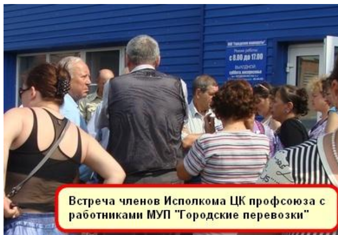
Встреча членов Исполкома ЦК профсоюза с работниками МУП "Городские перевозки"

Наблюдается недостаточная мотивация вовлечения в профсоюз